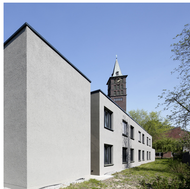
Apartmenthaus und Kirchturm, Bick von Westen