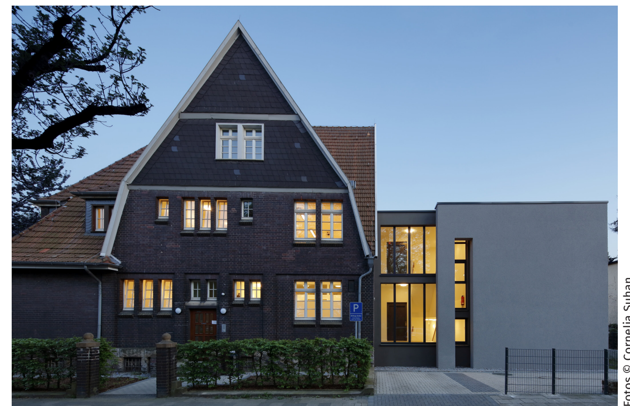
Ansicht von der Zeppelinstraße