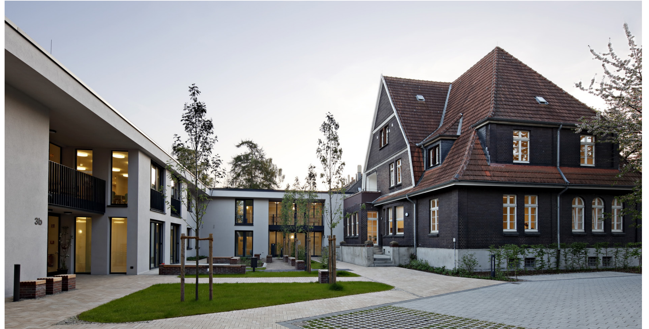
Blick in den Gemeinschaftshof