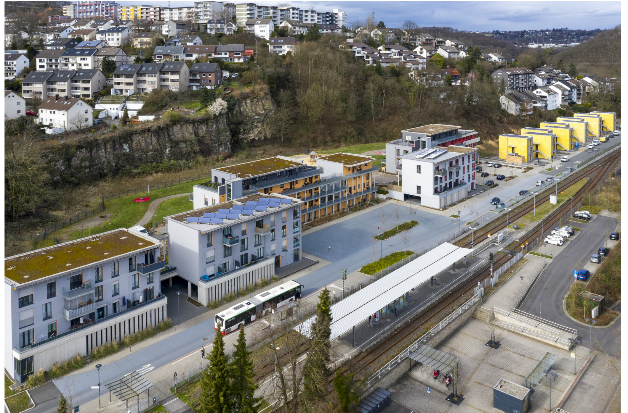
Blick auf das Quartier