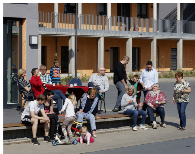
vor dem Gemeinschaftsraum