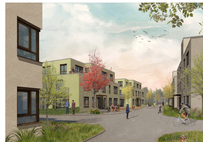
Blick in die Siedlung