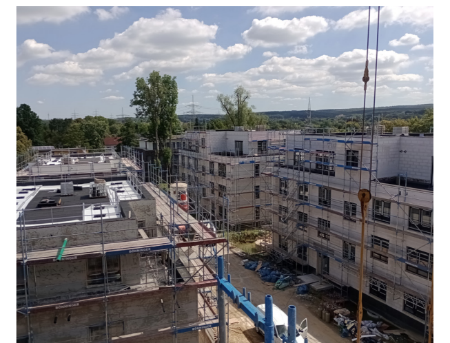
Baustelle, September 2023