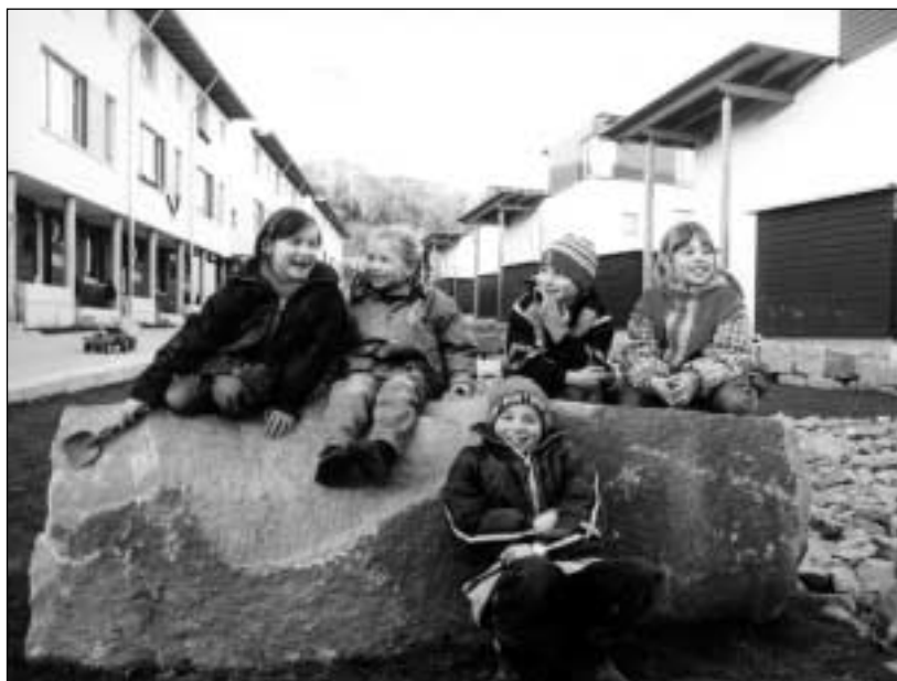
Abb. 1: Kinderfreundliche Siedlung Herdecke

Die Wohneinheiten der Gartensiedlung Herdecke gruppieren sich um eine autofreie, kinderfreundliche, kommunikative, künstlerisch gestaltete und damit insgesamt identitätsstiftende Mitte und bieten den Bewohnern zusätzlichen Raum zum Leben. Insofern