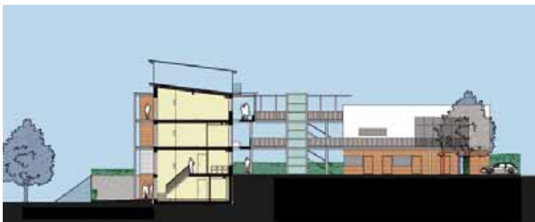
Bild 2.30: Querschnitt

Der Rückblick nach den ersten Jahren des Zusammenwohnens gewährt den Bewohnern einen entspannten Blick in die Zukunft. Die Erfahrungen aus dem langjährigen Prozess des Austausches und der Fähigkeit Kompromisse einzugehen und zu leben, haben zu einem harmonischen Leben in der Gemeinschaft geführt.