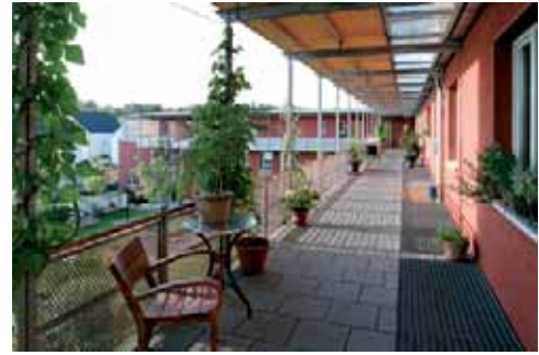
Bild 2.28: Laubengang

Dortmund errichtet. Gut angeschlossen an den Öffentlichen Personennahverkehr lässt sich die Innenstadt in wenigen Minuten bequem erreichen. Besonders wertvoll ist die direkte Nähe zum aufwendig erneuerten Tremoniapark, der mit seinen großzügigen Grünflächen ausgezeichnete Spiel-, Sport- und Aufenthaltsmöglichkeiten bietet.